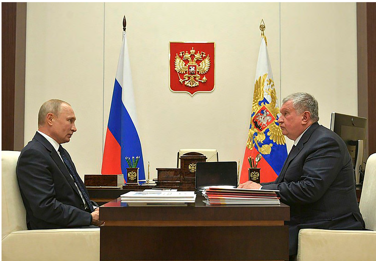
В. В. Путин провел рабочую встречу с Главным исполнительным директором ПАО «НК «Роснефть» И. И. Сечиным.

«Мы понимаем свою самую главную ответственность – за сохранение здоровья наших сотрудников, связанных с ними семей, людей. Ситуация полностью находится на контроле. Мы в постоянной работе находимся с региональными властями, с подразделениями Роспотребнадзора. Эта работа проводится каждодневно, мы будем стараться эту ситуацию контролировать в ежедневном режиме».