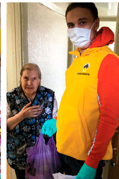
Отряды волонтеров доставляют на дом наборы продуктов представителям групп риска