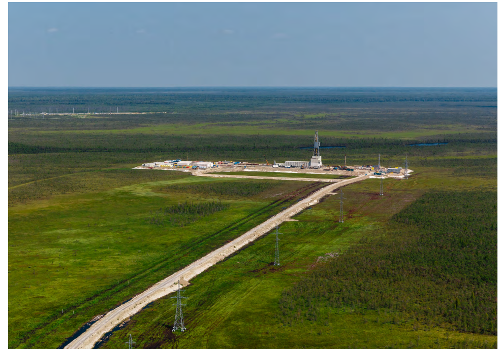
Сохранение окружающей среды для будущих поколений