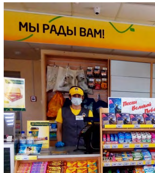
На АЗС: регулярная дезинфекция помещений, измерение температуры работников, контроль за соблюдением дистанции между клиентами, питание только навынос