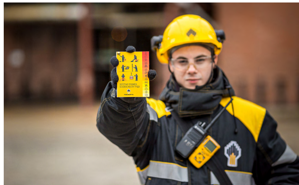
Обучение «Золотым правилам безопасности труда» прошли более 83 тыс. сотрудников Компании

Компания постоянно развивает компетенции работников в областях, связанных с наиболее высокими рисками безопасности труда, и укрепляет приверженность неукоснительному соблюдению правил промышленной безопасности и охраны труда. Взаимодействие проходит в различных форматах: обучение, «прямой диалог», распространение агитационных материалов. Важной частью обучения являются внутренние корпоративные тренинги, которые проводят 725 внутренних тренеров.