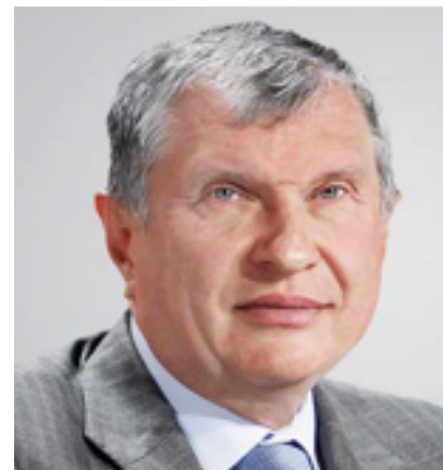
Игорь Иванович Сечин

Поэтому я рад представить видение и принципы устойчивого развития Компании, которые отражают наш ответственный подход и вклад в достижение 17 целей ООН в области устойчивого развития, которые интегрированы в стратегические и программные документы Компании.