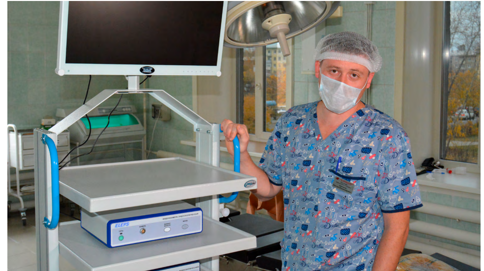
Ангарская нефтехимическая компания оказала финансовую помощь Ангарской городской детской больнице №1 в приобретении оборудования и проведении ремонта. Ежегодно через стационар больницы проходит порядка 7–8 тыс. детей и подростков г. Ангарска

Стратегическая инициатива «Доступное жилье» была сформирована на основе комплексной жилищной программы – одного из важных мотивационных инструментов корпоративной социальной политики, которая успешно реализуется в Компании в течение 14 лет.