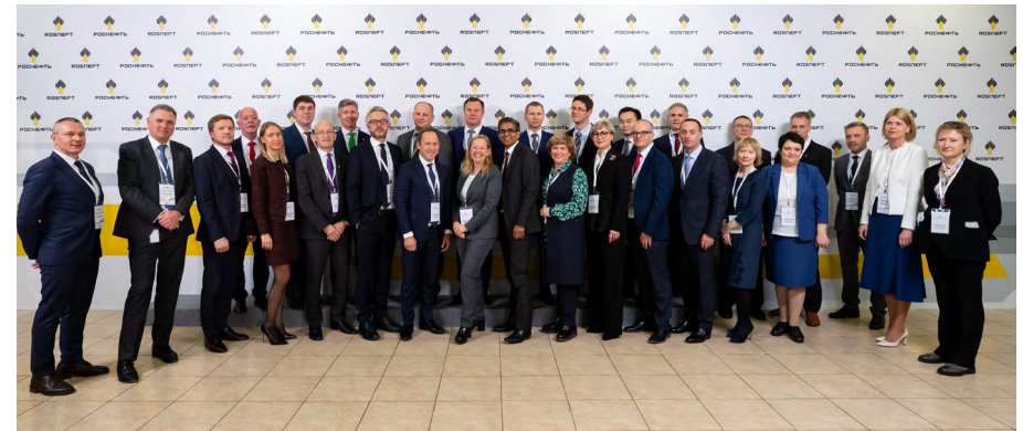
В 2019 году в ПАО «НК «Роснефть» состоялся семинар « Корпоративные подходы в области углеродного менеджмента » с участием топ-менеджеров Компании и представителей руководства BP и Equinor в России

«Роснефть» нацелена на открытый конструктивный диалог и ответственное взаимодействие с государственными организациями, бизнесом и обществом, руководствуясь нормами применимого законодательства и высокими стандартами корпоративной и деловой этики. Это расширяет возможности Компании и способствует созданию благоприятных условий для развития бизнеса. Ключевые направления взаимодействия – развитие и совершенствование федерального и регионального законодательства, нормативной отраслевой базы, продвижение ключевых инициатив по устойчивому развитию отрасли и регионов.