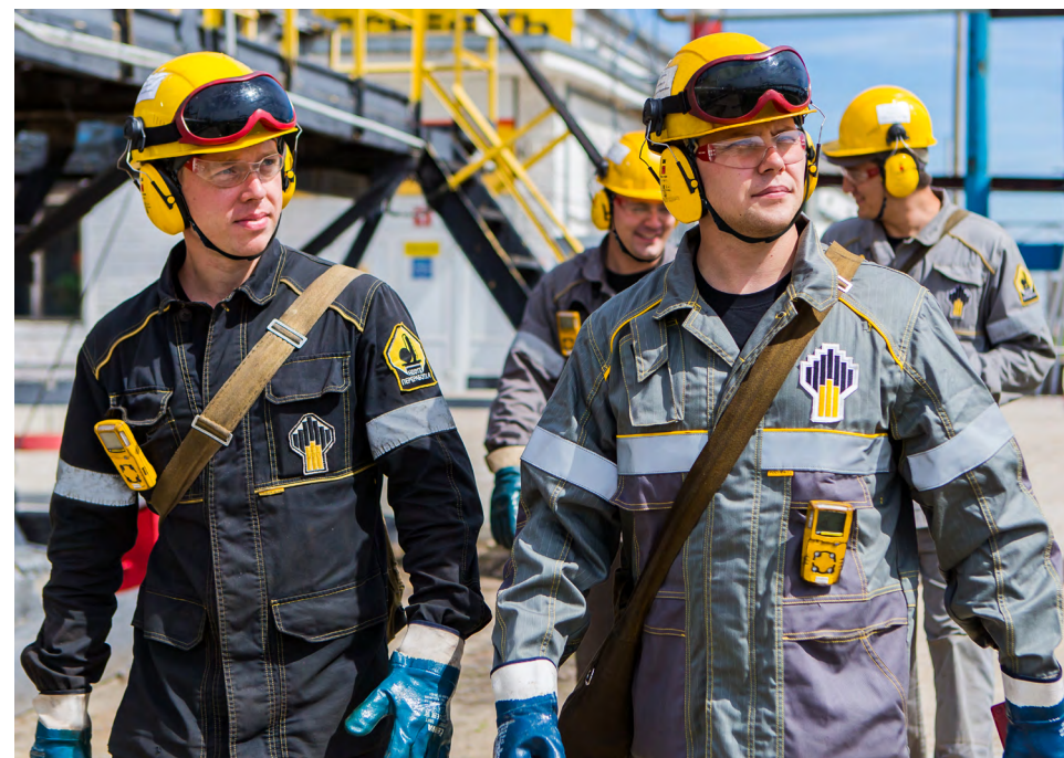
Компания нацелена на повышение эффективности деятельности

Цели в области роста производительности труда и снижения затрат включены в основные показатели оценки результатов деятельности руководства Компании (КПЭ).