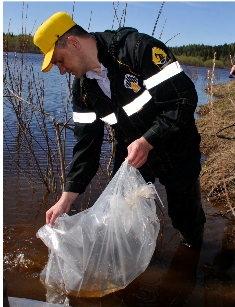
В 2019 году силами Компании были выпущены мальки различных видов рыб в Красноярском крае, Республике Саха (Якутия) и Республике Карелии, Архангельской, Тюменской и Сахалинской областях и ХМАО – Югре

В 2019 году «Роснефть» и Национальный парк «Русская Арктика» начали комплексный проект по восстановлению экосистемы самых северных территорий России – заповедного архипелага Земля Франца-Иосифа.