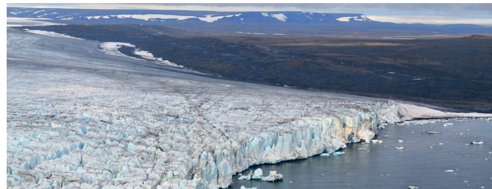
Авиасъемка побережья Карского моря

На лицензионных участках в морях российской Арктики и Дальнего Востока «Роснефть» осуществляет производственный экологический контроль и мониторинг, включающий попут-