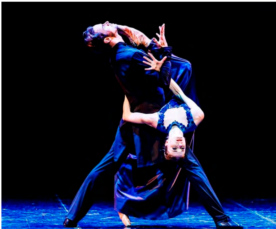
Компания оказывает поддержку Санкт-Петербургскому государственному академическому театру балета Бориса Эйфмана, который выступает с гастроллями в российских городах